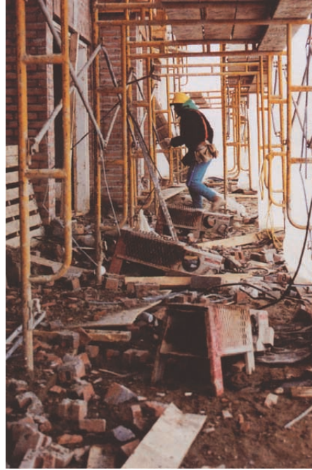
Lieux de travail en désordre