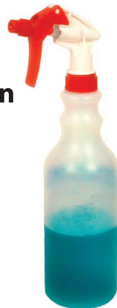
Bouteilles non étiquetées