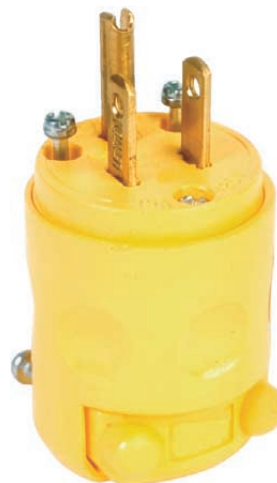
Fiche à trois broches