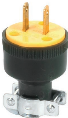
Fiche à deux broches